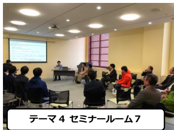
テーマ4 セミナールーム7