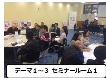
テーマ1～3 セミナールーム1