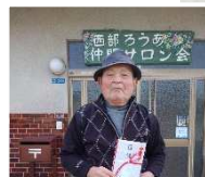
NPO法人西部ろうあ仲間サロン会(米子市)

NPO法人万葉のふるさと国府創生会(鳥取市)、久松橋ガーデンプラブ(鳥取市)、NPO法人西部ろうあ仲間サロン会(米子市)、NPO法人サポートイルカ(米子市)、NPO法人コーカラ健康塾(米子市)、NPO法人いるか(米子市)