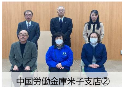
中国労働金庫米子支店②