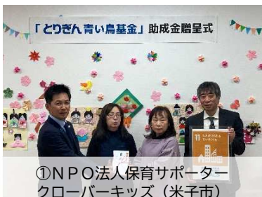
①NPO法人保育サポーターネットワークローバーキッズ(米子市)