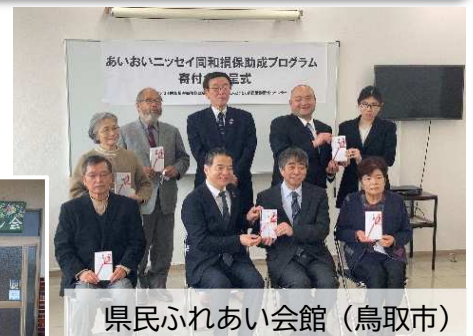
県民ふれあい会館(鳥取市)

あいおいニッセイ同和損保助成プログラムは、同社役職員による募金制度「MS&ADゆにぞんスマイルクラブ」で集まった寄付金に、同社より同額の寄付金を加えたマッチングギフトです。3月2日(水)県民ふれあい会館(鳥取市)において、令和3年度の「助成金贈呈式」が開催され、採択された6団体に助成金が贈呈されました。