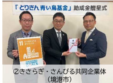
②きさらぎ・さんびる共同企業体(境港市)