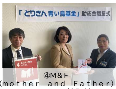
④M&F(mother and Father) support(鳥取市)