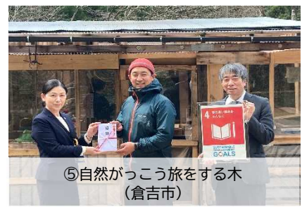
⑤自然がっこう旅をする木(倉吉市)