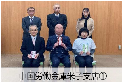
中国労働金庫米子支店①

中国労働金庫の普通預金口座を通じて、子ども・福祉・環境などの活動分野毎にいただいた寄付金の令和3年度配分先、7団体に2月24日(木)に寄付金贈呈式を行いました。